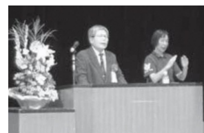
▲自身の体験を交えて講演する中さん(左)

家族を苦しめています。当事者である私が話をすることで、誰もがありのまま生きていくことができる社会にしたいです」と話されました。