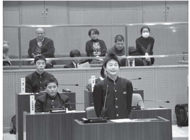
◀議場で町執行部に質問する甲佐中学生