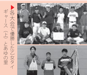
▶ 各大会で優勝した乙女タイギャース（上）とあゆの里