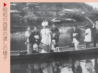
昭和の西原の渡しの様子

なお、現在のお堂は、平成の台風により倒壊したため、平成12年に建て替えられたものです。