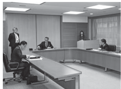
▲県庁で行われた立地協定調印式

町長が協定書に調印。大城代表取締役社長は、「新工場の操業で、輸出増と安定供給を実現したい」と話しています。