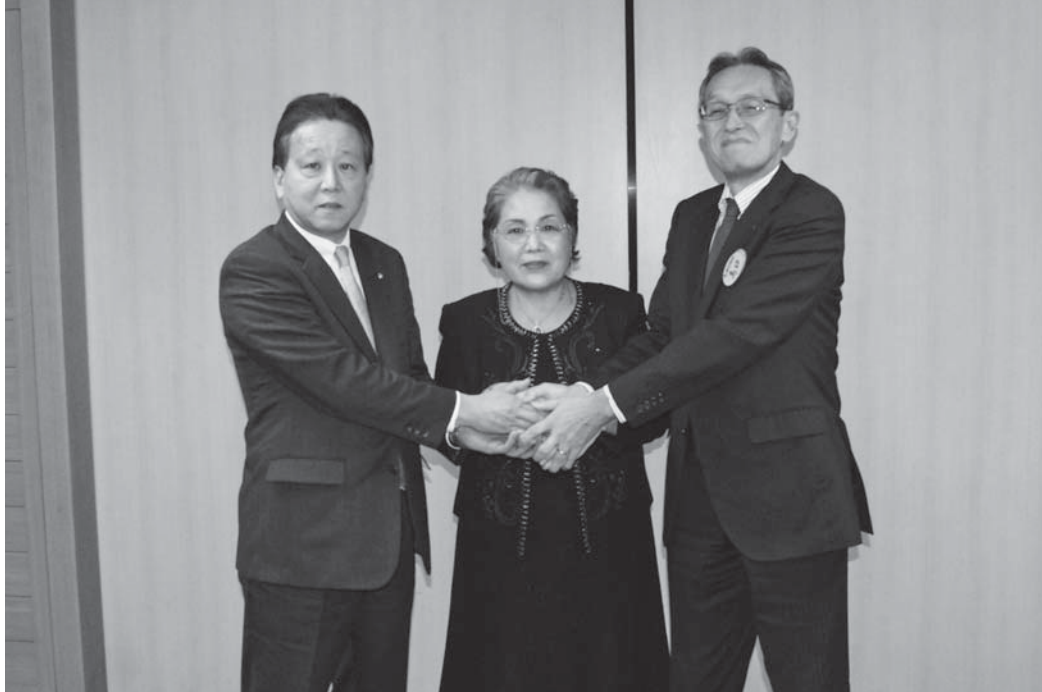
▲立地協定を結び握手を交わす奥名町長（写真左）と大城代表取締役社長（中）