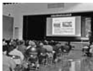
▲約120人が参加して開催された町公民館大会

が「区内での交流を大切にしたいため、区の行事や活動などへの参加が増えた」と発表。