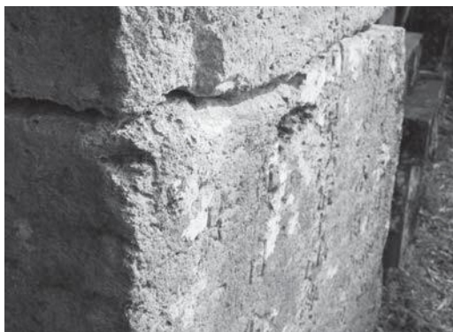
▲石碑に刻まれた文字が甲佐の歴史を今に伝えている