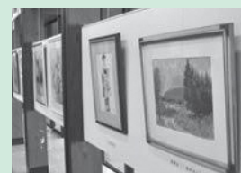
◀絵画や写真、手芸作品などを展示してみませんか。