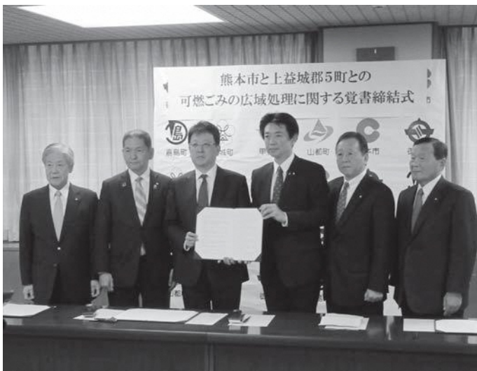
▲熊本市役所で可燃ごみの広域処理に関する覚書に署名した大西熊本市長と上益城郡5町の町長ら

3月30日(月)熊本市役所で、熊本市と上益城郡5町との「可燃ごみの広域処理に関する覚書」締結式が行われました。