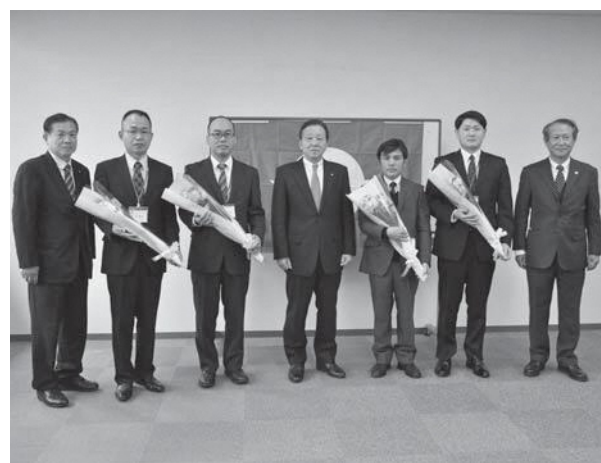
任期満了を迎えられた派遣職員4人