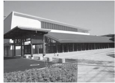
今年度もよりよい行政サービスを目指します