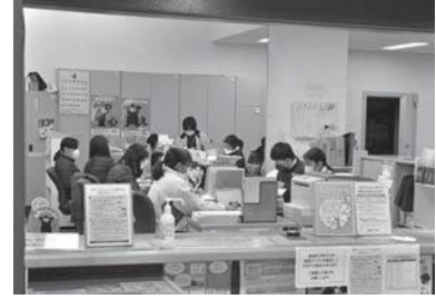
詳しくは町住民生活課へお問い合わせください