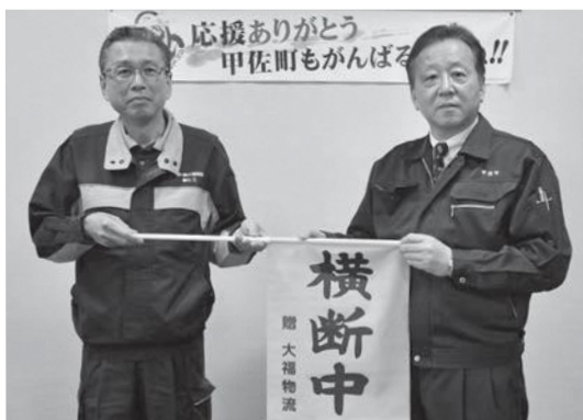
▲奥名町長に横断旗を手渡す春山安全品質対策室長（左）