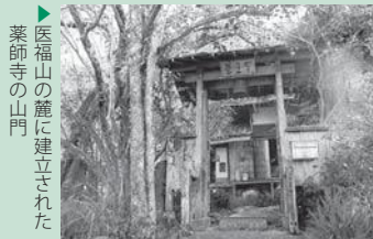
▶ 医福山の麓に建立された薬師寺の山門

現在は寺離れが進んでいると言われ、「もの」の価値観も多様化しています。少し立ち止まって物事を見詰め直す機会に寺を活用するのもいいかもしれません