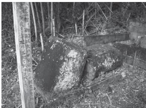
▲熊本地震により倒壊した石碑