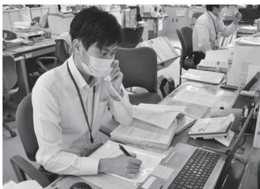
▲電話での問い合わせに対応する職員ら