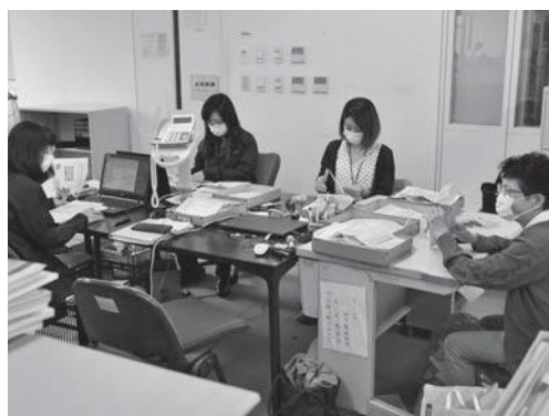
▲申請書の確認などの給付の手続きが進む