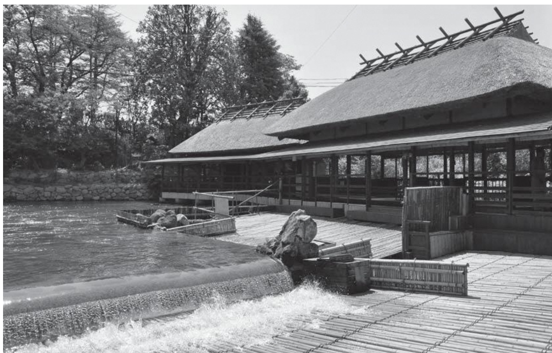
◀ 風情あるあずま屋でいただくアユ料理を求めて多くの人が来場するやな場