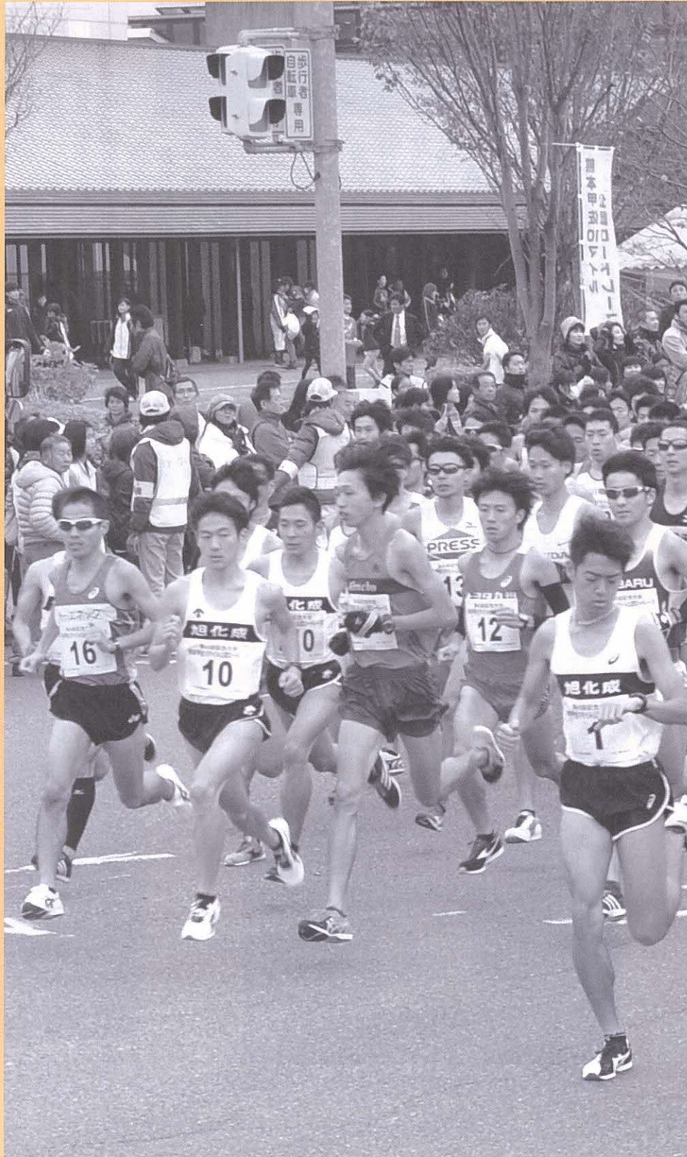
◆ 写真右・熊本甲佐10マイル公認ロードレース大会のスタート直後。10マイル一般競技者の部と国際競技者の部は同時スタート ◆ 写真左上・3マイル地点での中学男子5マイルの部 ◆ 写真左中・女子の部5マイルの部の3マイル地点 ◆ 写真左下・各部門の優勝者（前列左から中学、高校、一般、国際、女子、新人賞）と各賞受賞者（後列左から地元競技者賞、敢闘賞、女子敢闘賞）