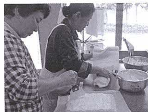
▲1人1本ずつ丁寧にロールケーキを巻く受講生たち

を紹介。水餃子は、米粉の特徴であるもちり感を出した皮を手作りし、ニラがたっぷり入った具を詰めま