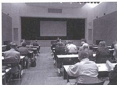
▲地域リーダー研修会の様子

キストV」を資料として活用して同研修会事務局から女性、子ども、高齢者、障がい者、同和問題などの課題やさまざまな人権問題に対して、私たちができることは何があるのかを説明しました。