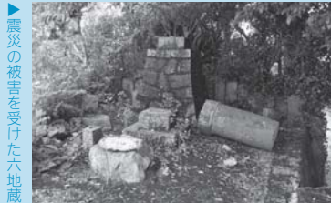
▶ 震災の被害を受けた六地蔵

す。これらの地蔵は、村の出入りに置かれることが多く、安全やいろいろな悪い病気の侵入を防ぐ予防の意味も込められていたでしょう。