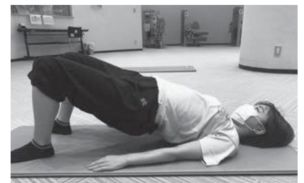
▲お腹と膝が直線になるようお尻をしっかりとあげましょう。