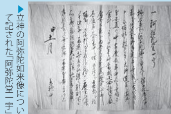
▶立神の阿弥陀如来像について記された「阿弥陀堂一字」

身長80㍍もある阿弥陀如来像です。寺院の本尊として大切にされてきたものと思われます。今後とも大事に守っていかねばならない文化財です。