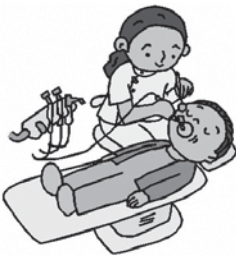
詳しくは町住民生活課へお尋ねください