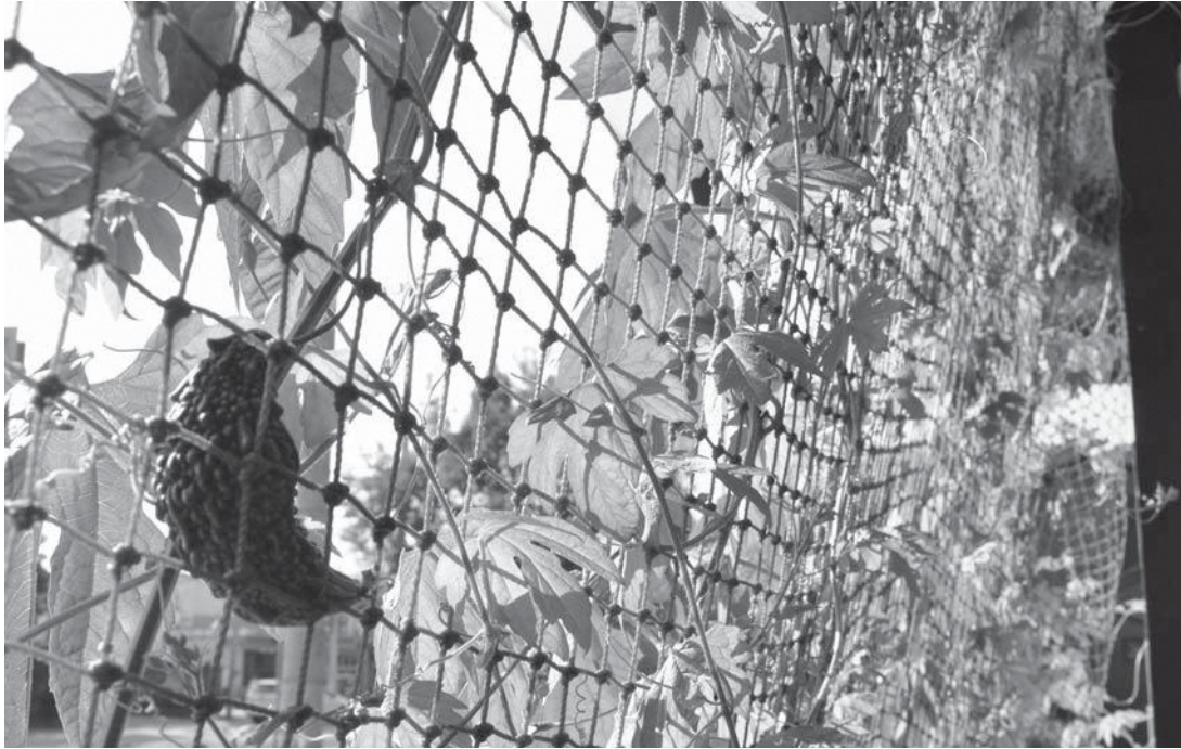
▲張られたネットをつたって育つゴーヤのグリーンカーテン