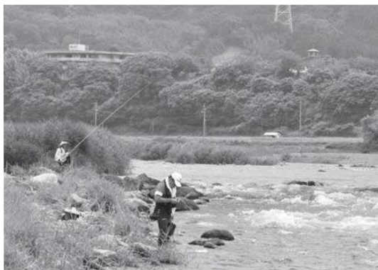
▲アユ漁解禁日から緑川で友釣りを楽しむ釣り人ら