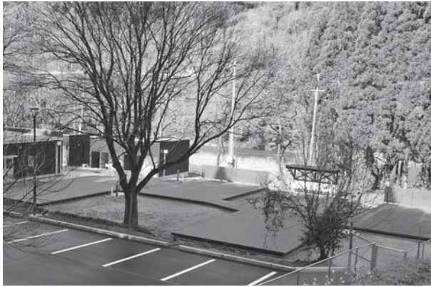
▲ベッドを備えた大型テントが並び予定のテラスの奥には宿泊者以外も利用可能なレストランやショップが併設されている

お2人でもゆつくり過ご していただける小型テント サイト（4カ所）と、ベッ ドも備えた大型テントサイ ト（4カ所）で快適なキャ ンプを楽しんでいただけま す。どちらも必要な道具は すべて備わっているため、