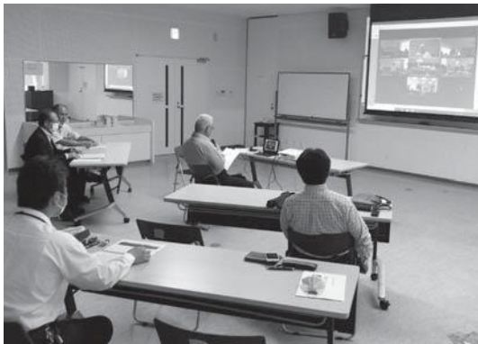
▲リモートで行われた人権教育部会の教職員研修

同研修は、町教育委員会と甲佐町人権教育推進協議会が主催。新たに本町に赴任した教員が、本町の現状や問題点を理解し、同和問題解決につながる学校人権教育を推進するために毎年実施。今回、新型コロナウイルス感染症拡大防止のため、はじめてリモートでの開催となりました。