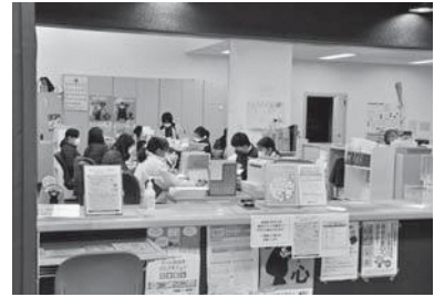
詳しくは町住民生活課へお尋ねください