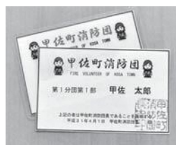
▲町が団員に対して発行する甲佐町消防団員証