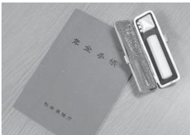
詳しくは町住民生活課へお尋ねください