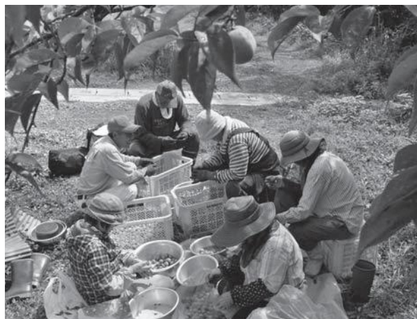
▲梅の木の下で収穫した梅を仕分ける参加者ら