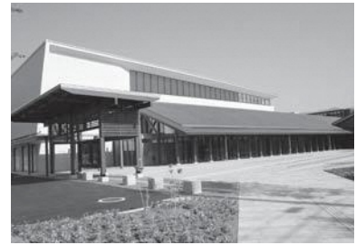
願書受付は8月24日(月)から9月11日(金)まで