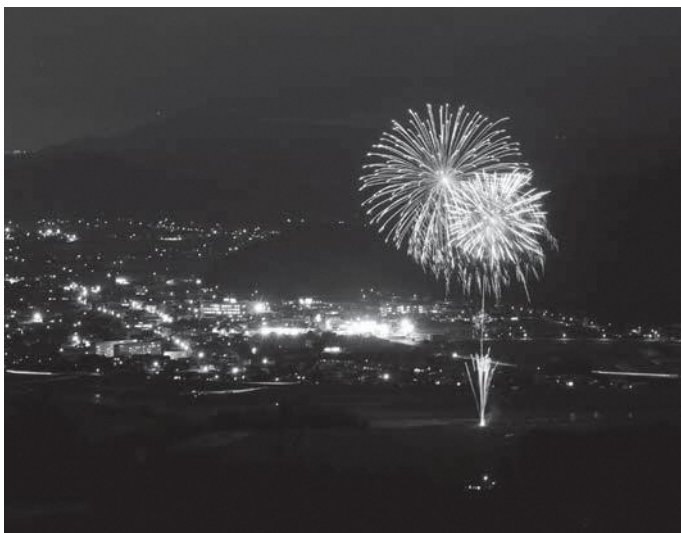
▲甲佐の町明かりを背景に、新型コロナウイルスの終息を願って緑川河川敷から打ち上げられた花火

6月1日（月）新型コロナウイルスの終息を願い、全国各地で一斉に花火を打ち上げる「Cheer up! 花火」プロジェクトが行われ、緑川河川敷で打ち上げられた大輪が甲佐の夜空を彩りました。