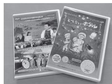
▲貸し出しについては、町社会教育課までお尋ねください。

● 人権に関するお問い合わせ先 町教育委員会社会教育課 ☎096-234-2447(内線324)