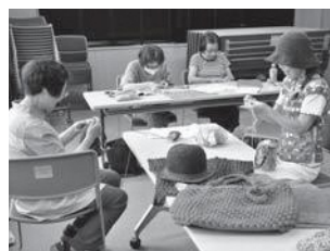
▲手編みでバックや帽子を作製する参加者の皆さん

健康で豊かな生き方を応援するため町公民館が実施する「公民館自主講座」についてご紹介します。