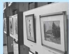
◀ 絵画や写真、手芸作品などを展示してみませんか