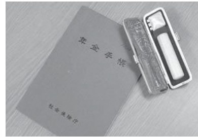
詳しくは町住民生活課へお尋ねください