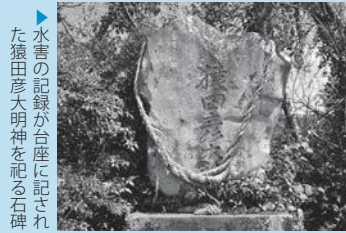
▲水害の記録が台座に記された猿田彦大明神を祀る石碑

今を生きる私たちは、先人たちの残した遺跡が語る言葉に耳を傾けなければなりません。