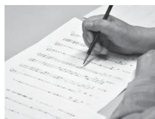
▲作品について意見交換や添削を行い短歌の理解を深めます