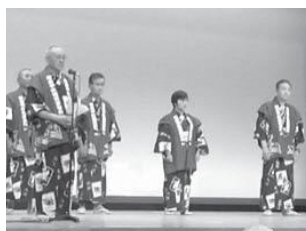
▲そろいの法被で甚句を披露する参加者の皆さん

文化・教養「相撲甚句」講座では、大相撲の巡業などで披露される七五調の囃子歌「相撲甚句」の練習を行っています。