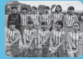
女子サッカースクール 参加者の皆さん サッカー頑張ってます！

●スポンジテニス教室&バドミントン教室 甲佐小体育館 月曜日(祝日除く) 午後7時30分