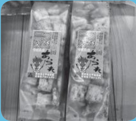
「二ラえびあられ」 こうさんもん No.16