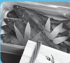
「鮎の甘露煮」 こうさんもん No.1