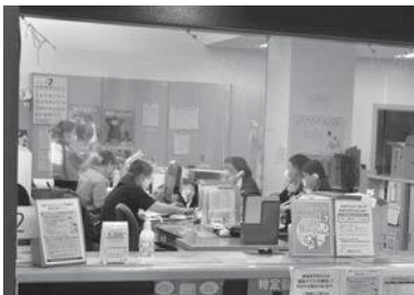
詳しくは町住民生活課へお尋ねください