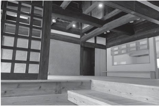
▲宿泊施設を併設した古民家交流拠点施設は吹き抜けに架かる太い梁が古民家の歴史を感じさせる

平成28年熊本地震で被災した旧西村邸（仁田子）。一時は取り壊し案も出た築約140年の古民家を資源として活用するため、町では「こうさてんプロジェクト」を起ち上げました。甲佐の地名を冠するこの事業は、世代を超えた交流の拠点として、約140年の歴史と現在が交わる空間