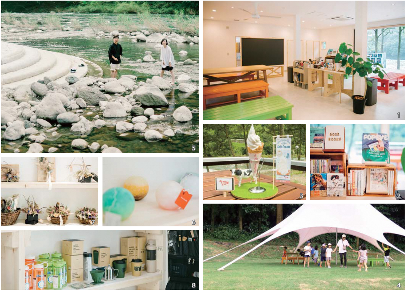
1、2_「COMMON SPACE」はカフェと本屋が一体のくつろぎスペース 3_カフェで販売中の吉井牧場「夢みるく」ソフトクリームは緑川を望む開放的なオープンテラスで 4、白いスターシェードが目を引き芝生エリアでは不定期でイベントなどを開催予定 5_河原エリアでは水遊びを楽しめます(遊泳禁止) 6、7、8_「COMMON SHOP」は手作りキャンドルやドライフラワー、アウトドアグッズを取り扱う3店が複合ショップとして出店中