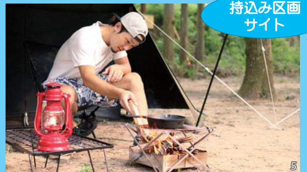
持込み区画 サイト