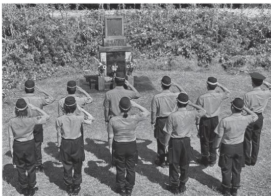
▲故山崎警部補慰霊碑に敬礼する御船警察書員ら