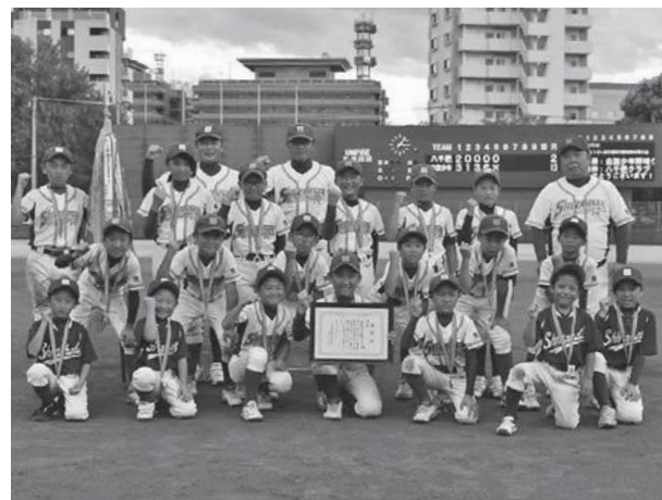
▲県大会で優勝した白旗少年野球クラブの選手ら