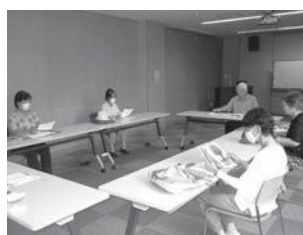
▲感染予防のためマスクを着用しながら練習する参加者

ており、日々の練習の成果は、施設訪問などで入所者の皆さんに披露しています。お孫さんへの読み聞かせをしたい方も、ぜひご参加ください。