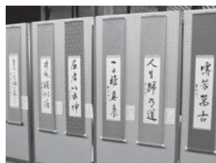
▲昨年の産業文化祭で展示された参加者の作品

健康で豊かな生き方を応援するため町公民館が実施する「公民館自主講座」についてご紹介しています。