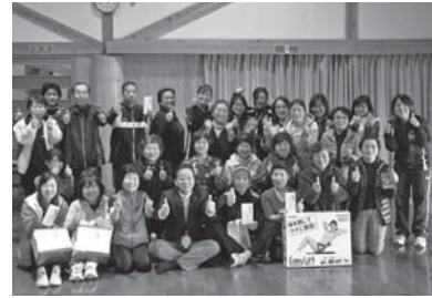
昨年も多くの人に参加いただきました