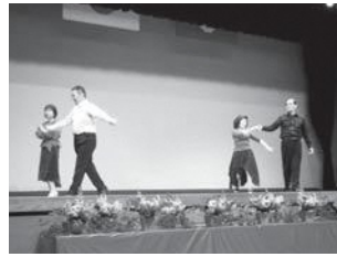
▲昨年の産業文化祭でダンスを披露する参加者

スポーツ・健康「社交ダンス」講座では、ダンスの基本から応用までを学びます。現在、参加者9人が、ブルースやワルツ、ジルバ、ルンバ、タンゴなどさまざまなテンポのダンスについて