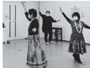
▲ ゆっくりとした動きでダンスを練習する参加者の皆さん

スポーツ・健康「フラダンス」講座は、ハワイアンメロディーに合わせて軽やかなステップを踏みながら踊るフラダンスを学ぶ講座です。現在6人が楽しく体を動かしています。ゆっくりとした動きでダンスを練習する参加者の皆さん