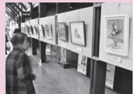
親子で制作した作品をぜひご覧ください。