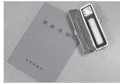
詳しくは町住民生活課までお尋ねください