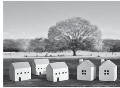
詳しくは町地域振興課にお尋ねください