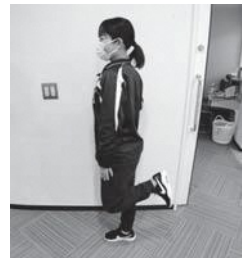
▲背筋を伸ばして膝・足をしっかり曲げ伸ばしましょう