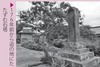
176年前から迫の地にた たずむ石塔

経典の中から法華経が選ばれている点にこの地域の素養の高さを垣間見る思いがする。発願については、もう少し聞き取りをし、当時の人々の思いを読み取りたい。