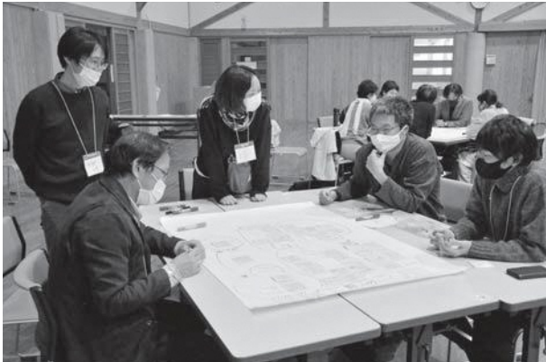
▲生まれ変わった旧西村邸を見学後、施設の利活用について意見交換する改修ワークショップの参加者ら