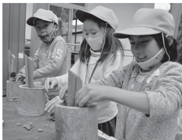
◀自分だけの門松づくりに取り組む児童たち