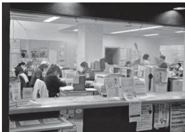
詳しくは町住民生活課までお尋ねください

で計算されます。加入の届け出が遅れたり、ほかの保険に加入したのに国保をやめる届け出をしないままだと、保険料と国保税を二重に支払ってしまふこととなります。