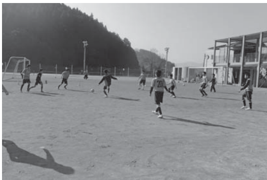
▲甲佐中グラウンドでミニゲームなどを行う小・中学生

同教室は「平成28年熊本地震」からの復興を目指し、スポーツによる元気づくりを目的とした熊本県体育協会の「絆に感謝！がんばろう熊本」プロジェクトの一環として町が主催。町内の小・中学生約70人が参加しました。参加した子どもたちは、同クラブのコーチの指導の下、ドリブルやシュートなどさまざまなメニューを練習。最後にコーチたちとのミニゲームを楽しみました。