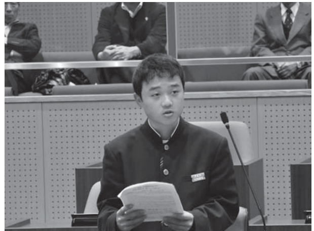
▲一般質問で町執行部へ質問する甲佐中生徒