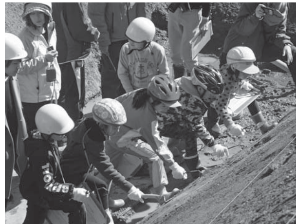
◀地層の表面を削り土の色を確認する白旗小児童