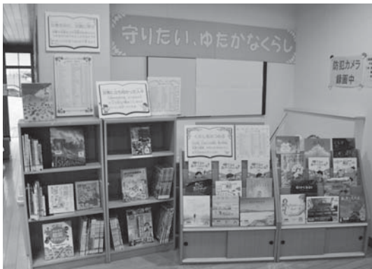
▲町図書室「楽しい絵本展」は3月6日（月）まで開催