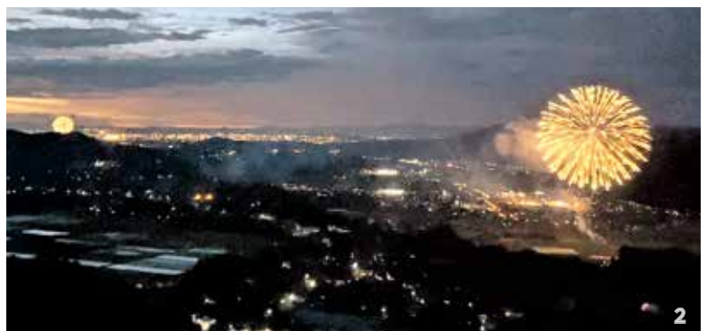
1_津志田河川自然公園（乙女河原）では打ち上げ花火が夕闇に浮かぶ金峰山と共演 2_夜空に現れた2つの大輪が甲佐の夏に彩りを添える 3_前回、田口橋下流で花火が打ち上げられたのは、あゆまつりが2日間開催されていた30年以上前までさかのぼる