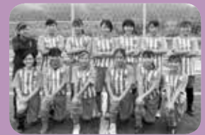
女子サッカースクール