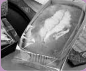
「梅酒カステラ」 こうさんもん No.10