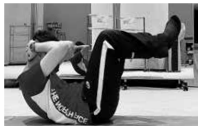
▲足で作った輪っかに両肘と頭を通すイメージで下腹部を刺激しましょう

●お問い合わせ先 甲佐町フィットネスセンター (町総合保健福祉センター内) ☎096-235-8712