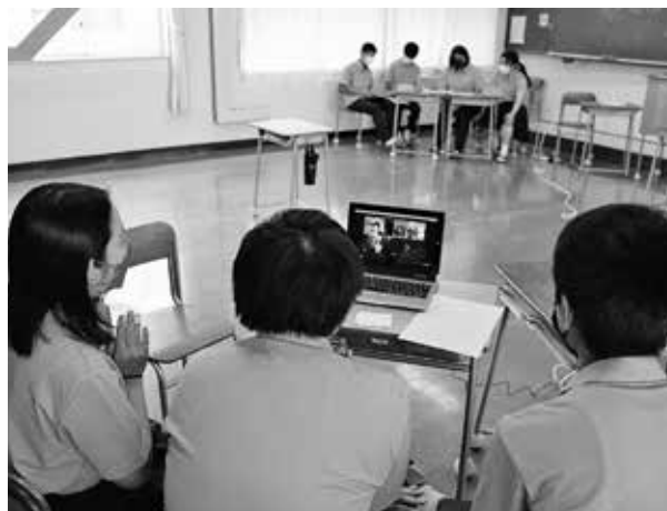
▲オンラインで専門家と対話する甲佐高校生たち