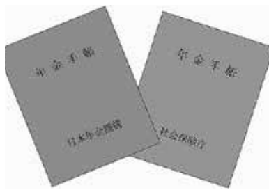
詳しくは町住民生活課へお尋ねください