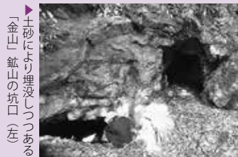
▶土砂により埋没しつつある「金山 鉱山の坑口（左）」

■お問い合わせ先 町教育委員会社会教育課 ☎096-234-2447（内線322）