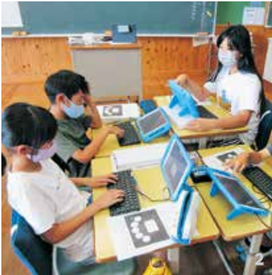
1_ 電子黒板とデジタル教材を使った授業では、子どもたちの考えを共有できる 2_ 外付けキーボードを使って入力作業などの基本操作を学ぶ子どもたち

ICTによって授業の幅が広がり、子どもたちもタブレット端末が導入されてから、より意欲的に授業を受けています。 算数の立体図形問題では、今まで平面でしか見ることのできなかったものが、タブレット端末で立体を回転しながら見ることができると、苦手な子どももイメージしやすく学習ができています。音楽や体育の授業で