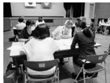
▲グループ討議で意見交換する参加者の教職員ら