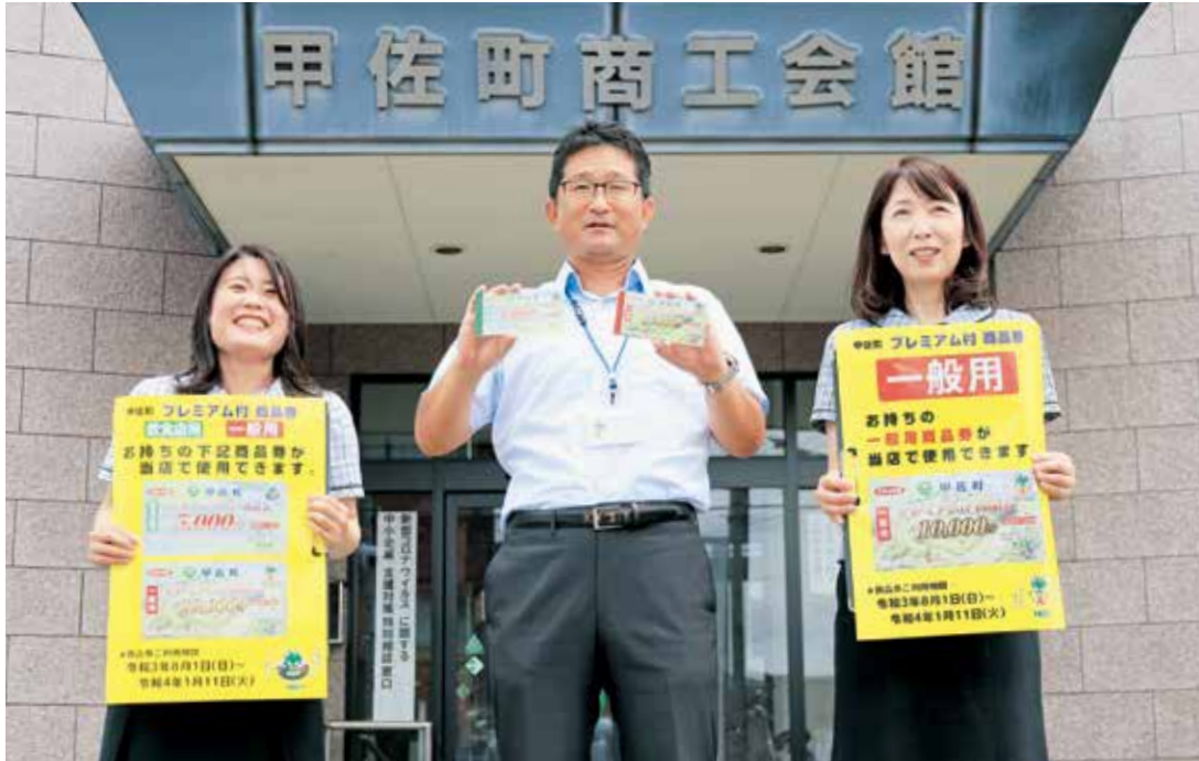
▶プレミアム付商品券は甲佐町商工会館で販売しています