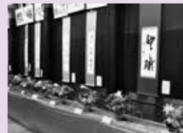
▶新成人に贈る作品の数々をご覧ください。