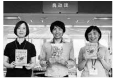
農政課窓口でお配りしています