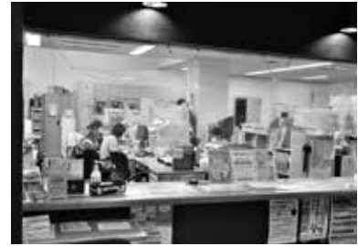
詳しくは町住民生活課へお尋ねください