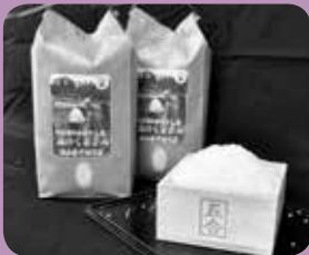
「西寒野のかけ干し米」 こうさんもん No.11

昔ながらのかけ干しで自然乾燥させたお米 ▶西寒野のかけ干し米 ☎096-285-5644