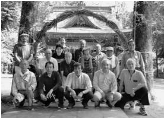
▲茅の輪づくりに参加した岩下、緑町、仁田子の皆さん

地域住民らが緑川河川敷などで刈り取ったカヤを直径3尺ほどの茅の輪に仕立て、参道に設置。30日には神事が行われ、参拝者が茅の輪をくぐりコロナ禍の終息を願いました。