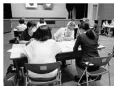
▲グループ討議で意見交換する参加者の教職員ら