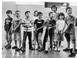
▲ゴルフの基本を気軽に楽しめるスナッグゴルフに挑戦

最初に町生涯学習センターで、道具の説明とランチャーと呼ばれるクラブの握り方の指導を受けて、ボールを打つ練習をしました。