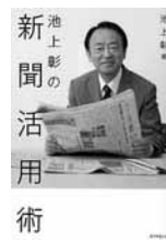
ダイヤモンド社 一般書

書く力、伝える力、数学力、発想力や想像力、コミュニケーション力まで！読むだけで、仕事や勉強に役立つスキルの身に付け方を伝授。世の中にあふれる情報の中で、新聞をどう読み、活用するべきか。新聞をなんとなくしか読んでなかった人や、中学生・高校生にお勧め。読んだ後は、新聞の読み方が変わることは間違いありません。