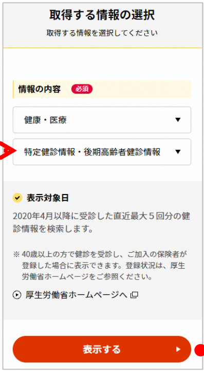
特定健診情報・後期 高齢者健診情報を選択