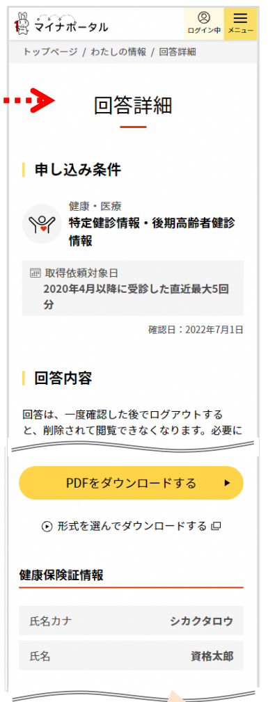
健康保険証情報を表示 PDFをダウンロード可能