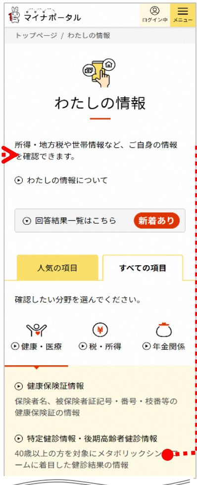
※令和2年度実施分以降の特定健診情報、 後期高齢者健診情報が対象