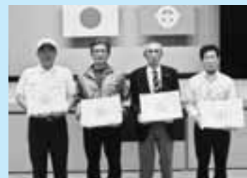
功労者・優秀者の皆さん