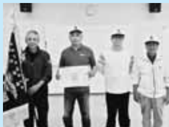
総合優勝の甲佐地区

また、町生涯学習センターで開催された開会式で、同協会からスポーツ功労者(3人)およびスポーツ優秀者(1人)の表彰も行われました。