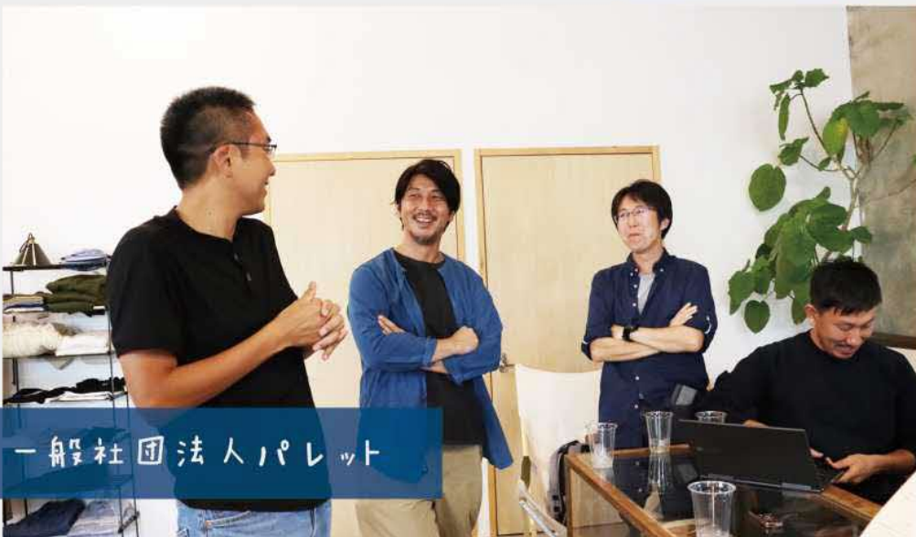
一般社団法人パレット

「リーズナブルな金額で流行りなものや、 髪に良い事、お洒落を楽しんでください！」