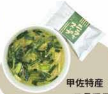
甲佐特産「ニラ」 ニラでスープ