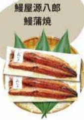
鯉屋源八郎 鰻蒲焼