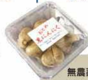
無農薬栽培 黒にんにく