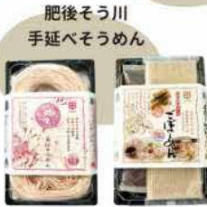
肥後そう川 手延べそうめん