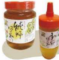
前田養蜂園 はちみつ