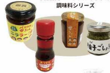
甲佐宮内「パワフル母ちゃん」 調味料シリーズ