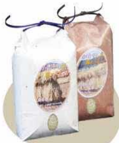
甘くて美味しい 西寒野のかけ干し米