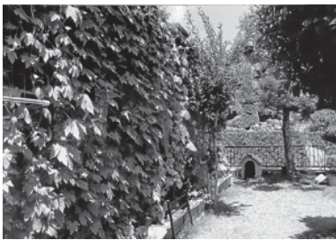
昨年度の最優秀賞に輝いたゴーヤのカーテン