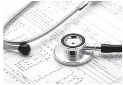
健診は健康づくりの第一歩です