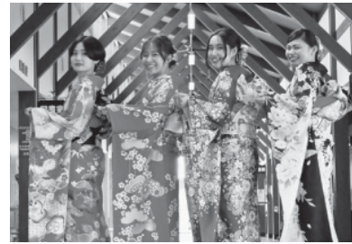
詳しくは町社会教育課へお尋ねください