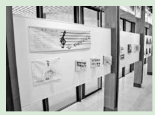
子ククク会 布の絵本展