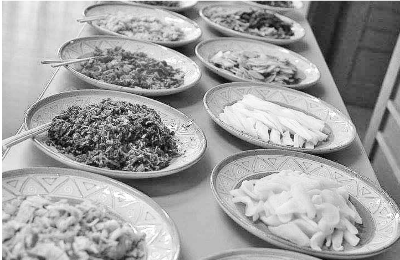
5月3日(水)に甲佐町ろくじ館で開催された漬物バイキング(ろくじ館)