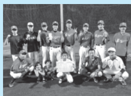
優勝した岩上ロックアップの皆さん