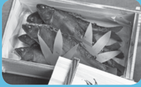
「鮎の甘露煮」 こうさんもん No.01 ▶(有) 守り屋 ☎096-234-0016

「ふるさと甲佐応援寄附金」にご協力いただき、ありがとうございます。氏名掲載に同意いただいた寄附者の皆さんを一部ご紹介します。