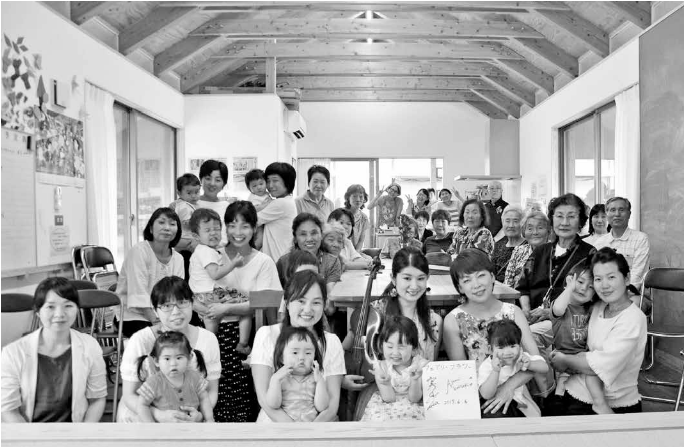
6月6日(火) フェアリーフラワーの復興支援コンサート後に記念撮影(白旗仮設団地内集会所)